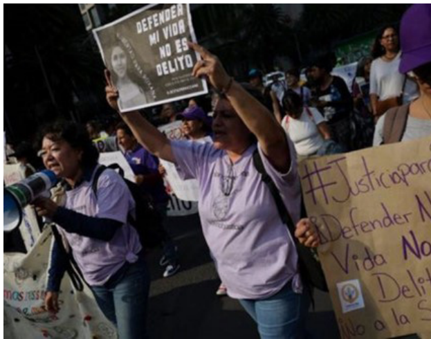
La sentencia de más de seis años de prisión fue un gran varapalo para la joven.

Estado de México, un municipio en el que están vigentes sendas alertas por feminicidios y desapariciones.