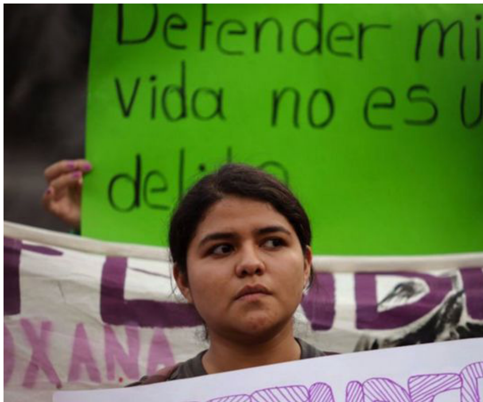
Varias protestas reclamaron la absolución de Ruiz.

"Yo estuve a punto de morir. ¿Cómo es que después de abusar sexualmente de ti, te meten a la cárcel por defenderte y luego quieren que pagues una reparación de daños a la familia del tipo que te violó? Eso es injusto, es una barbaridad", se pregunta la joven en conversa-