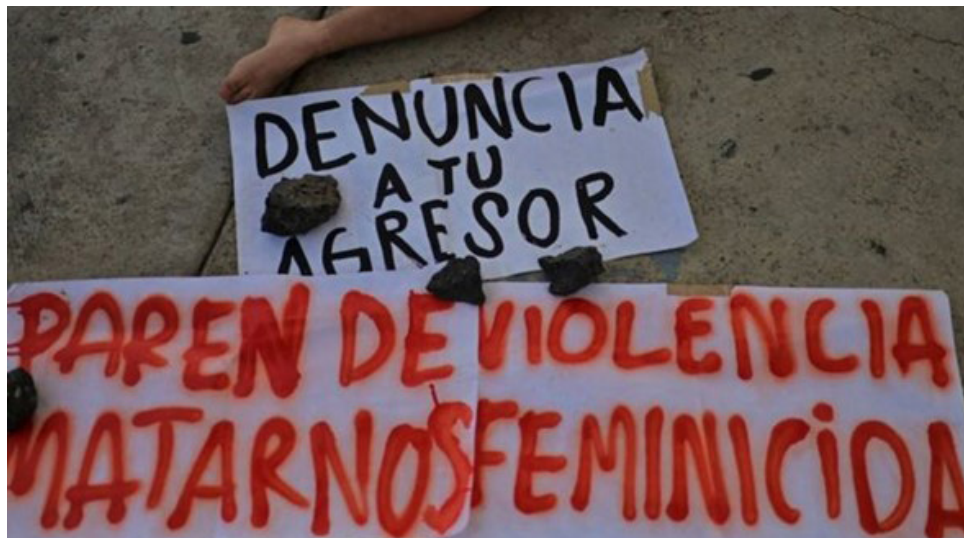
Ruiz contempla su futuro como parte del activismo contra la violencia hacia las mujeres.

Pocos días después, la Fiscalía estatal decidió abandonar el caso como parte acusatoria y