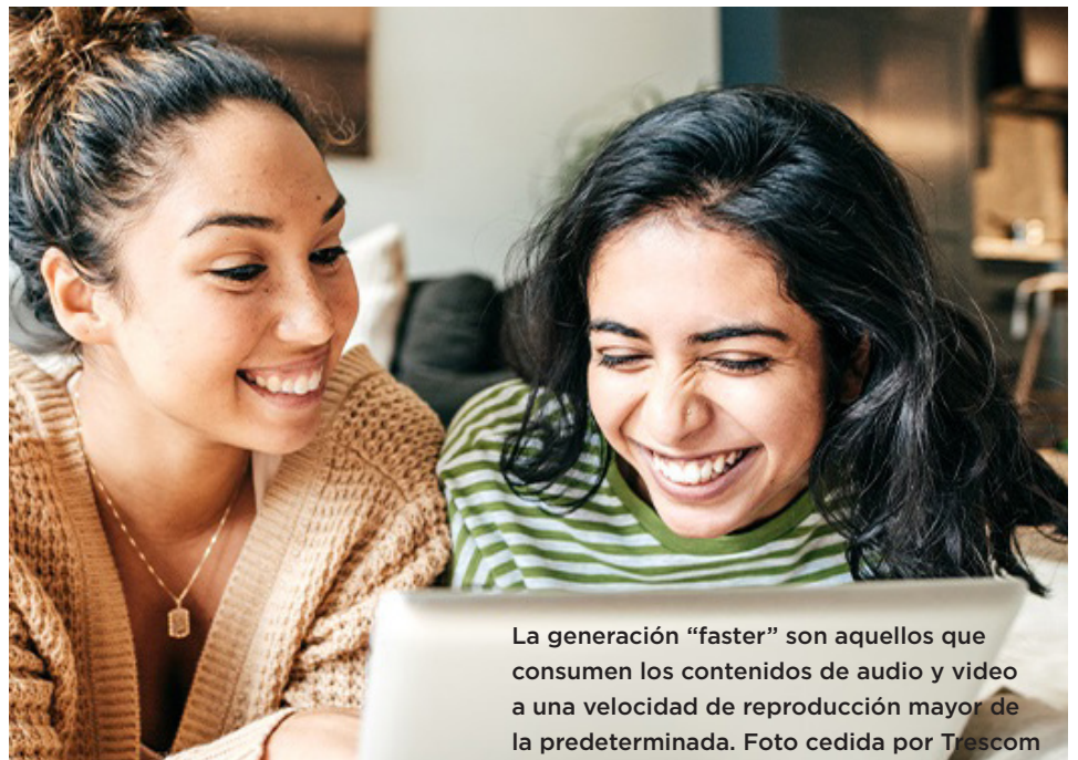
La generación “faster” son aquellos que consumen los contenidos de audio y video a una velocidad de reproducción mayor de la predeterminada.

De acuerdo con el Informe “Estado del podcast en español” presentado por la plataforma Ivoxx, un 3.64% de los usuarios consultados acelera la velocidad de reproducción de los capítulos habitualmente y