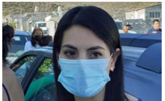
La diputada local urgió a la Federación a coordinarse en las jornadas de vacunación anti-COVID19 a personas 40-49 de Arteaga y General Cepeda.

Finalmente, la diputada dio a conocer que ha recibido reclamaciones de adultos mayores y quienes ya han sido vacunados con una primera dosis, y que la queja es que ya pasó mucho tiempo y no tienen para cuándo inyectarse la segunda dosis, por lo que de nuevo urgió a la autoridad Federal a coordinarse de una manera adecuada y cuando menos responda a los vacunados resolviéndoles sus dudas.