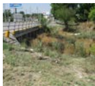
Con la temporada de lluvias encima los fraccionamientos del norte de Saltillo continúan a la espera de iniciar la canalización del arroyo Cuatro Bajo y Medio y prevenir inundaciones.