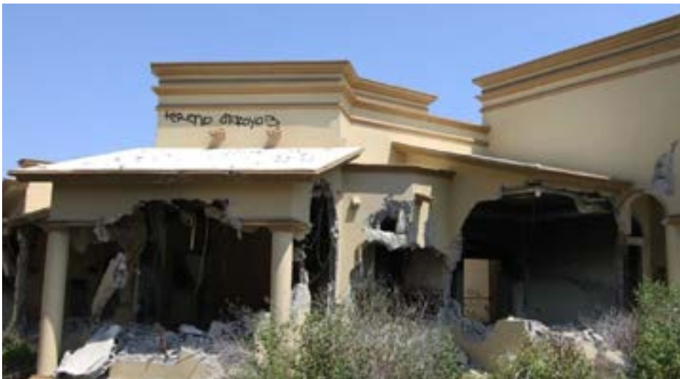
Colectivos de búsqueda han denunciado que entonces, cuando fue la matanza, las líneas de emergencia recibieron más de mil 200 llamadas provenientes de Allende y Piedras Negras por diversos incidentes y, pese a dichas alertas, nadie acudió a prestar auxilio.

Sin embargo, fue hasta este 2021 que el abanico de opciones que tienen que ver con la reforestación se abrió e incluyeron plantas originarias de la región, por ejemplo, cactáceas, magueyes o nopales, inclusive pirules y pinabetes que se plantaron en ciertas partes de la localidad que son muy áridas pero que la planta se adapta muy bien.