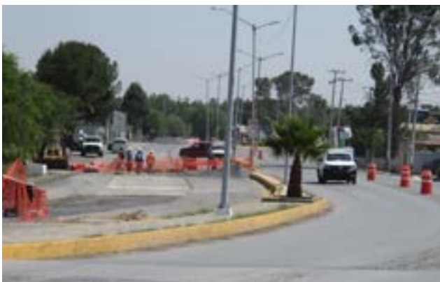
Hace días la Conagua autorizó el proyecto de ejecución de canalización del arroyo Cuatro Bajo y Medio al norte de Saltillo y no ha iniciado la obra.